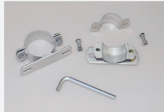
Le matériel de montage est livré avec le panneau.

Le montage des panneaux aux endroits précisément définis est à la charge de la personne responsable de l'exploitation ou de l'alpage.