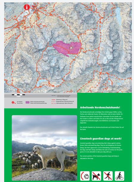
Exemple d'un encart double destiné à un grand panneau d'information. (Lieu : Andermatt UR).