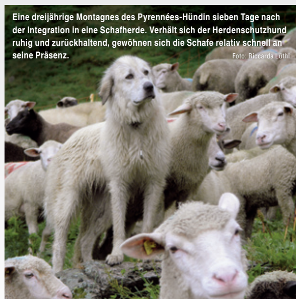
Eine dreijährige Montagnes des Pyrénées-Hündin sieben Tage nach der Integration in eine Schafherde. Verhält sich der Herdenschutzhund ruhig und zurückhaltend, gewöhnen sich die Schafe relativ schnell an seine Präsenz.

ihrem ursprünglichen Aufgabengebiet und den dazugehörigen rauen Lebensbedingungen sind Herdenschutzhunde äusserst witterungsunempfindlich. Der Schutztrieb und das starke Territorialverhalten gehören zu ihren herausragenden Eigenschaften. Ihre Arbeit erledigen sie weitgehend selbständig. Grundsätzlich wird alles Fremde innerhalb ihres Territoriums misstrauisch betrachtet und beim geringsten Anflug einer Gefahr verjagt. Ist die Herde ruhig, legen Herdenschutzhunde für gewöhnlich eine stoische Gelassenheit an den Tag, und eine Gleichgültigkeit gegenüber unbedeutenden Reizen. Jedoch kann der vermeintlich dösende Hund sich in Sekundenschnelle zu einem imposanten, reaktionsschnell abwehrenden Schutzhund verwandeln. Der sparsame und sinnvolle Einsatz seiner Kräfte ist massgebend für den effektiven Schutz seiner anvertrauten Herde. Der gut geführte Herdenschutzhund beobachtet den Eindringling – Wanderer, Biker – aus sicherer