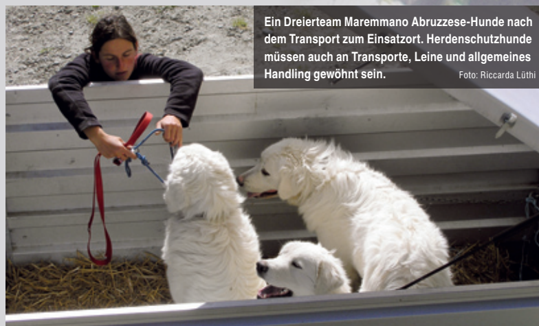
Ein Dreierteam Maremmano-Abruzzese-Hunde nach dem Transport zum Einsatzort. Herdenschutzhunde müssen auch an Transporte, Leine und allgemeines Handling gewöhnt sein.

Distanz, präsentiert sich diesem und macht sich deutlich bemerkbar, meist mit intensivem Gebell. In der Regel platziert er sich zwischen seiner Herde und dem Eindringling. Und wenn es ein Bär ist.