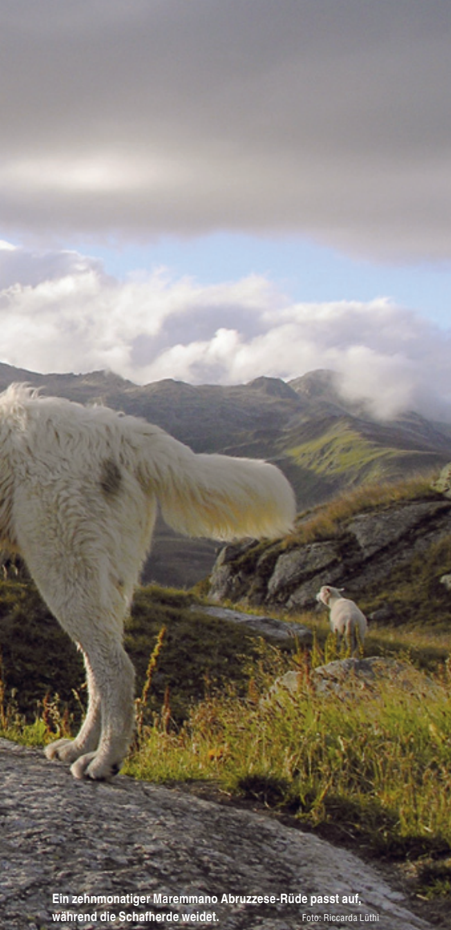
Ein zehntonatiger Maremmano Abruzzese-Rüde passt auf, während die Schafherde weidet.

Bei den meisten Ausfällen gibt es keine Entschädigung. Bei Wolf, Luchs- und Bäriss hingegen übernimmt der Bund den finanziellen Schaden. Das Wehklagen der Schäfer befremdet. Insbesondere weil verletzte oder kranke