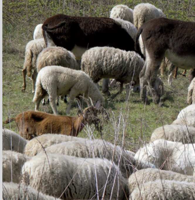
1000-köpfige Schafherde mit Eseln, Ziegen und sechs Schutzhunden in Norditalien. Auch in Norditalien musste die Arbeit mit den Schutzhunden wieder neu gelernt werden, denn auch hier sind die Wölfe erst Anfang der 90er-Jahre wieder zurückgekehrt.