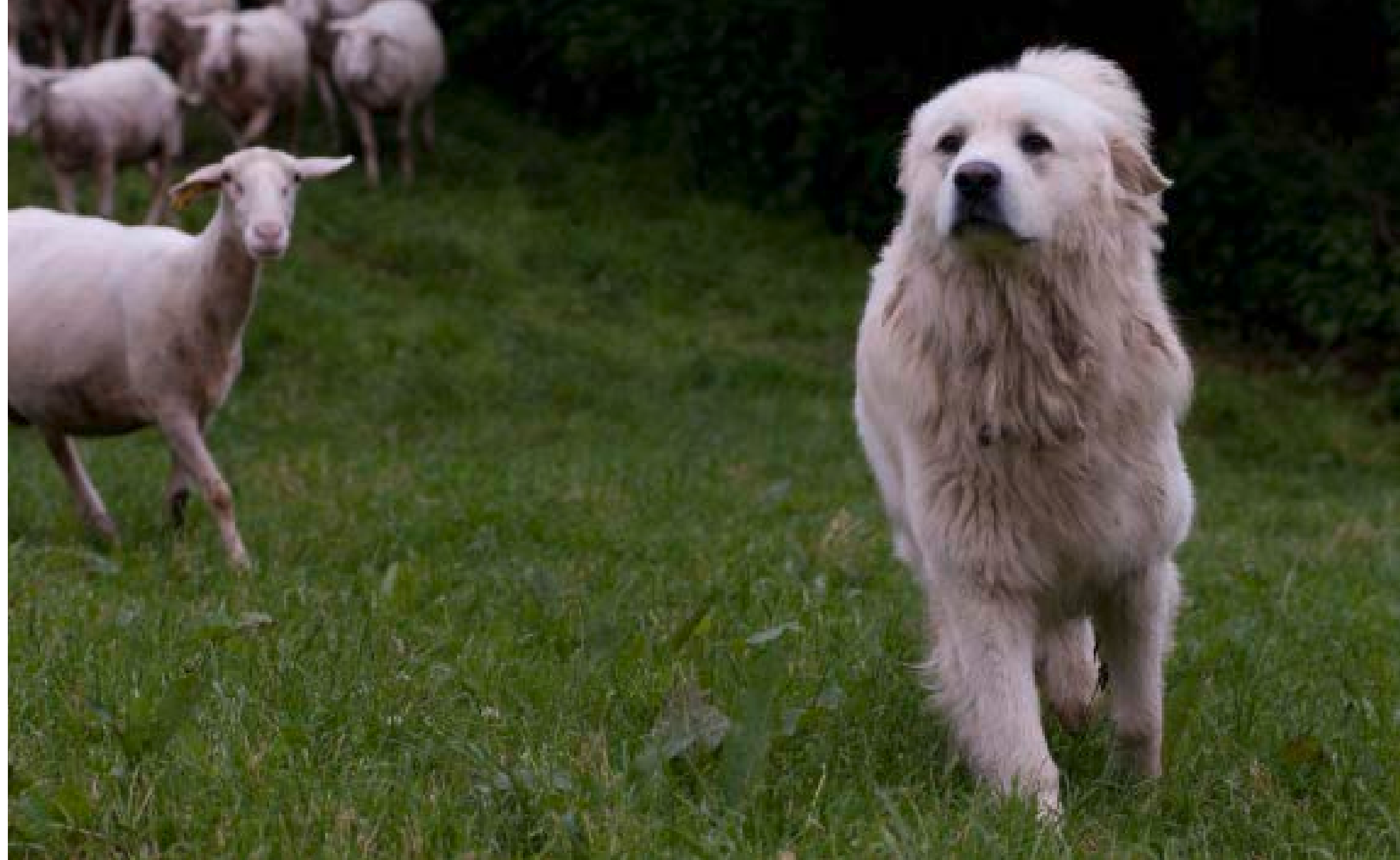
Im Gegensatz zu Hütehunden wie etwa den Border Collies arbeiten Herdenschutzhunde selbstständig. Ihre Aufgabe ist die Abwehr fremder Tiere an der Herde.

Unbekanntes im Umfeld der Herde, und dazu gehören auch Wanderer, wird von den imposanten Hunden misstrauisch begutachtet und möglichst von der Herde ferngehalten. Insbesondere in der Dämmerung und nachts sind die Hunde sehr aufmerksam und reaktiv, ebenso wenn die ganze Herde in Bewegung ist. Treffen Sie auf durch Herdenschutzhunde geschützte Herden, so gelten folgende Empfehlungen: - Wenn Sie in ein Weidegebiet kommen,