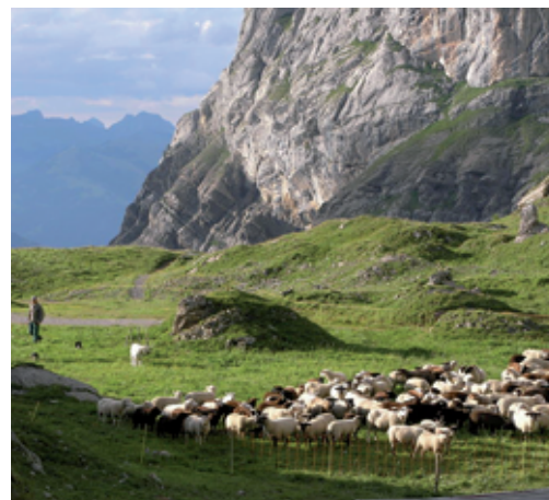
L'utilisation de CPT demande de la part de la personne qui les prend en charge des connaissances supplémentaires et de l'expérience.