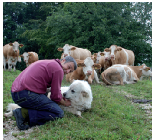
Il faut procéder à des contrôles réguliers et entretenir un contact intense avec les CPT.

Les règles de comportement les plus importantes peuvent être transmises à l'aide du dépliant «Les chiens de protection gardent leur troupeau».