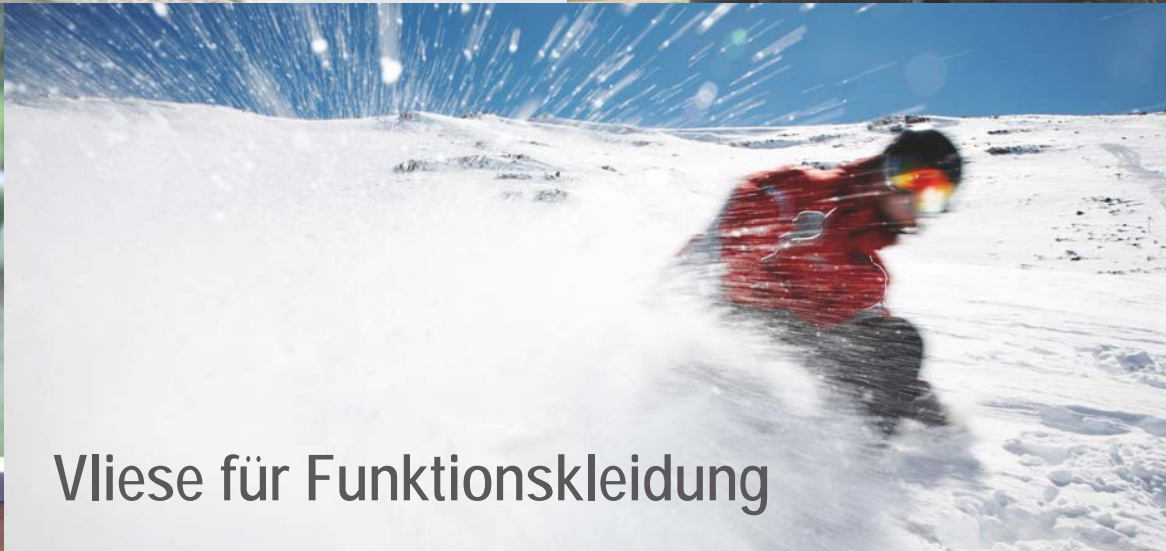
Vliese für Funktionskleidung