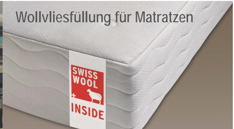
Wollvliesfüllung für Matratzen